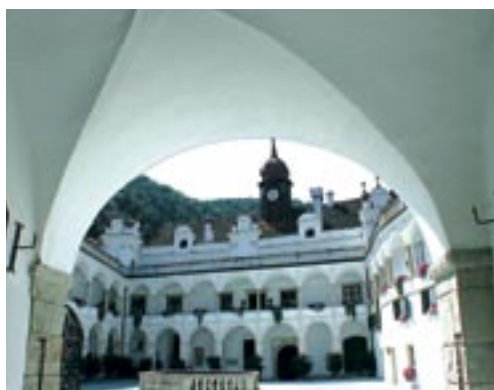
KPÖ brachte Licht in den Herberstein-Sumpf