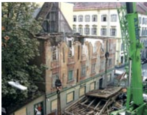
KPÖ will Altstadtgesetz nach Kommodhaus-Abriss

I m Landtag machte die KPÖ erfolgreich gegen die Privatisierung des Trinkwassers mobil. Die KPÖ setzte die Fortführung des Heizkostenzuschusses durch.