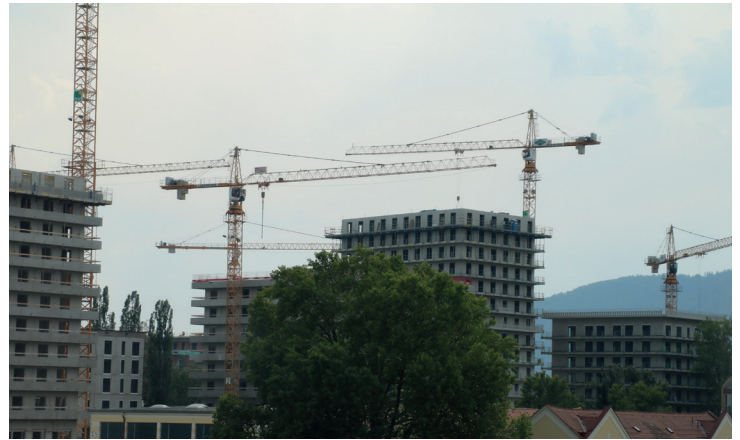
Der Bauboom ist nicht nur ungebrochen, die Bautätigkeit hat sich letztes Jahr mehr als verdoppelt.

letzten Jahren besonders die Bezirke Straßgang, Jakomini und Liebenau betroffen. Alleine letztes Jahr wurden in Straßgang 111.159 m 2 und in Jakomini 159.492 m 2 zuvor unversiegelte Flächen zubetoniert.