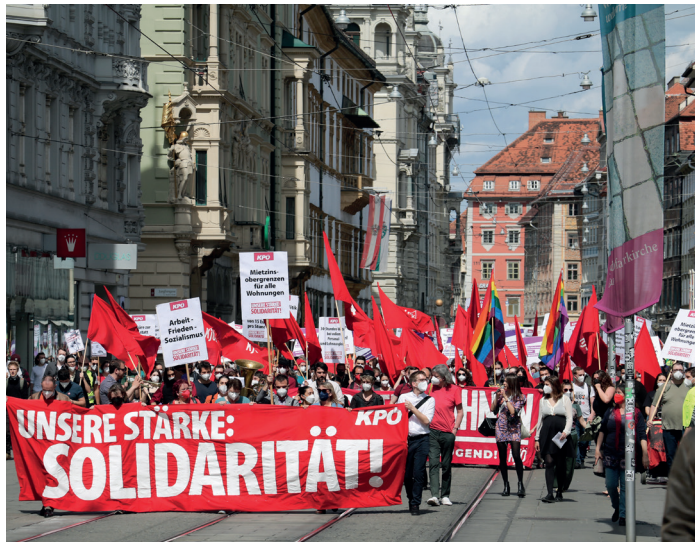
Ein starkes Zeichen: Mehr als 500 Menschen marschierten gemeinsam mit der KPÖ am 1. Mai durch die Innenstadt.

Die Rede bei der Schlusskundgebung am Eisernen Tor wurde von KPÖ-Stadträtin Elke Kahr gehalten. Sie betonte, dass die Krise gezeigt habe, wer die Gesellschaft wirklich am Laufen halte: „Es sind die arbeitenden Menschen – LKW-Fahrer, Ver-