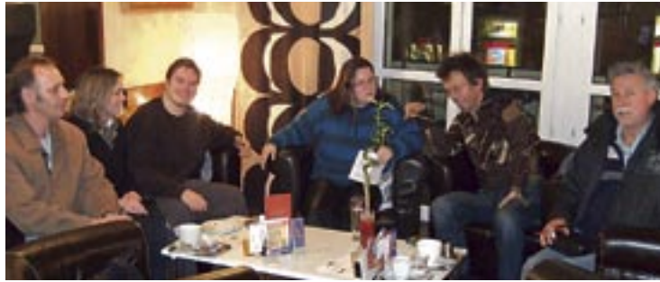
Beratung und Hilfe für Arbeitslose beim vierzehntägigen Stammtisch.

Arbeitslose Menschen suchen effektive Lösungen (= AMSEL). Der Verein AMSEL vertritt die Interessen von Arbeitslosen und fordert mehr Verteilungsgerechtigkeit.