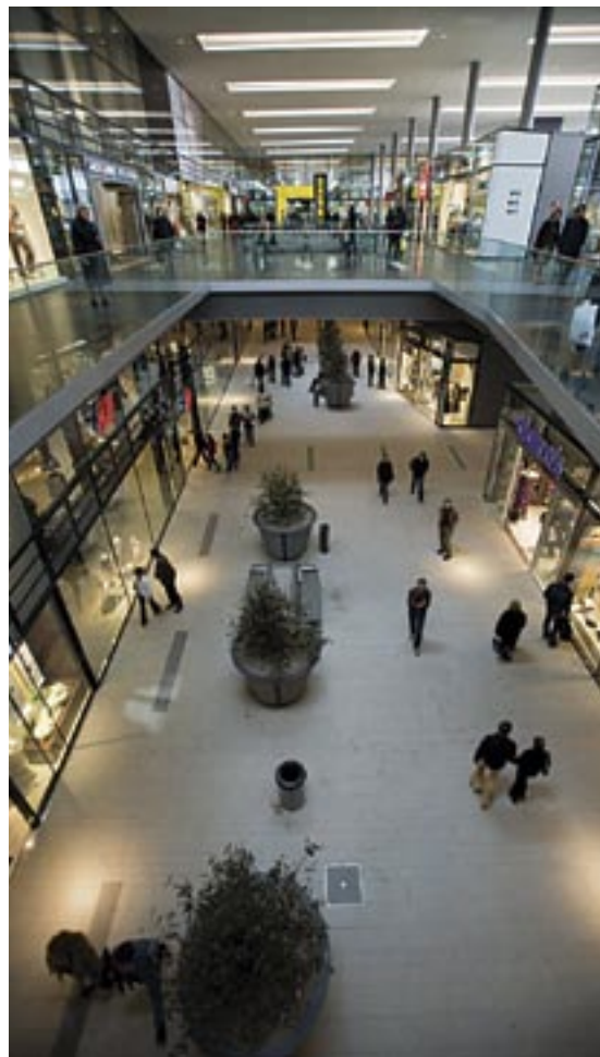
Länger Einkaufen – Gewinner sind die Handelskonzerne.

Die KPÖ Dist gegen derlei Verschlechterungen. Lange Arbeitszeiten, mangelnde Kinderbetreuung, schlechte Bezahlung sind nicht im Sinne der arbeitenden Menschen.