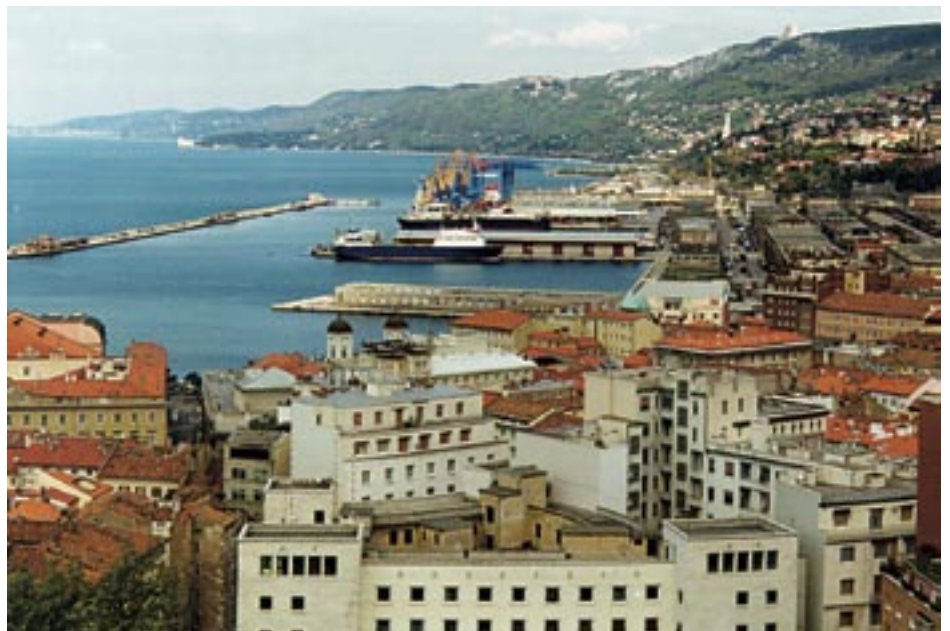
Triest – der Hafen.

Der Zerfall der Donaunarchie trennte die beiden Städte. Die gemeinsame Geschichte sollte Ansporn sein, die Kontakte auch in der Gegenwart zu pflegen.