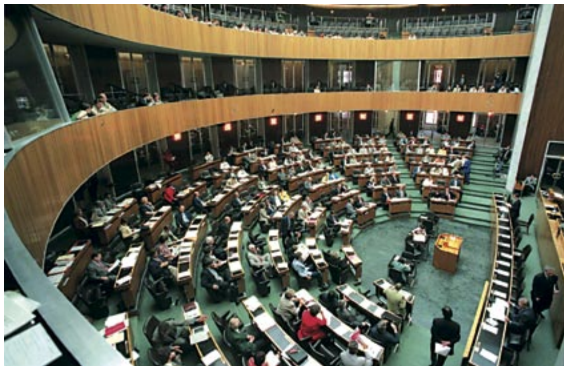
Teures Haus. Allein die 183 Nationalratsabgeordneten verdienen zusammen brutto 1,47 Millionen Euro pro Monat – mehr als 20 Millionen Schilling... BIGSHOT