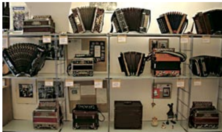
Spenden für den Erhalt des Harmonikazentrums: PSK, BLZ 60000, Kto-Nr. 1.238.620