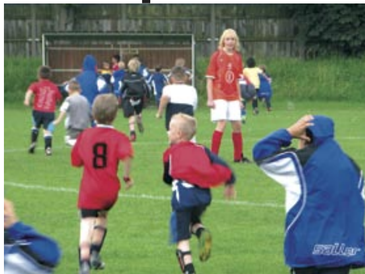
Kinder ab 6 Jahren trainieren zweimal pro Woche beim GSV Wacker.

Bleibt pro Jahr ein Minus von mehr als 10.000 Euro, von dem allein 7.500 Euro an die Sportunion für die Platzmiete gehen. Nun haben sich viele neue Mädchen angemeldet. Konrad: „Ab Herbst wollen wir mit drei Mädchenteams spielen.“ Die Freude der Kinder sei riesig, die Probleme, zu Spon-