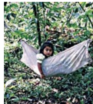
Eine andere Welt ist möglich – im Hochland von Chiapas. infos: www.cafe-libertad.de ; www.zeltainternacional.org/esp/el-intergalactico-va.html

indigenen Gemeinschaften in ihrem Kampf um Würde und Gerechtigkeit. Beim KPÖ-Bildungsverein kann „Café Libertad“ getrunken und gekauft werden.