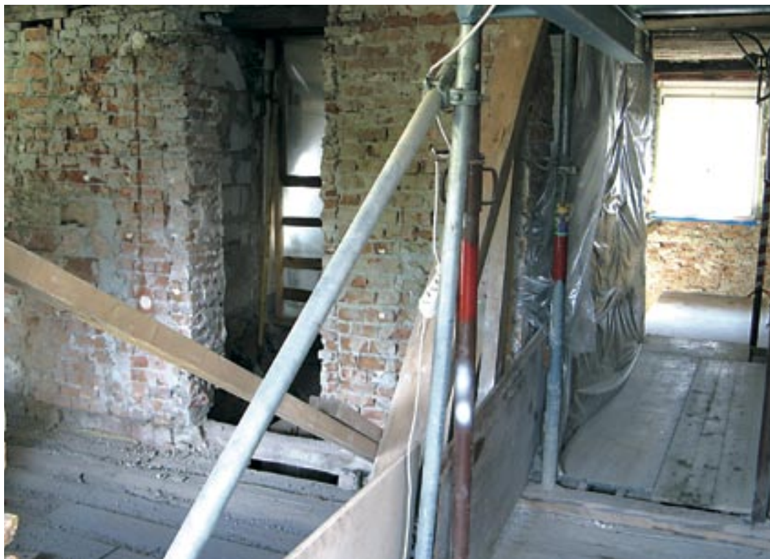
Vermieterwillkür. So sieht ein Haus innen aus, in dem Vermieter ihre Mieter loswerden wollen. In dieser Baustelle leben Menschen. Mehr darüber erfahren Sie im nächsten Stadtblatt.